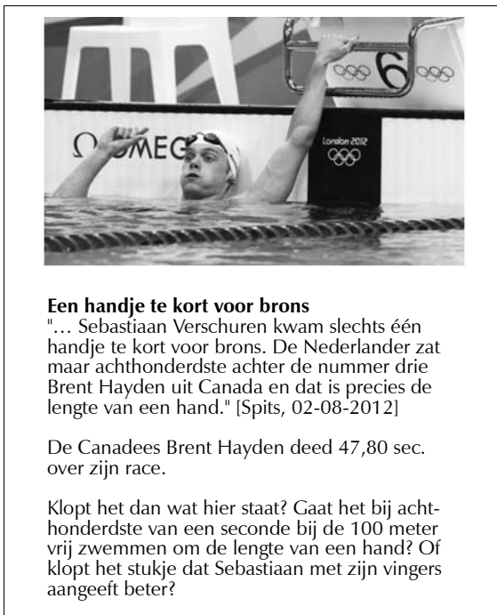
Figuur 4. Een vraagstuk over snelheid.

We ontwikkelden een model dat in onze ogen perspectieven biedt om op deze manier te functioneren. Om hier meer zekerheid over te krijgen, toetsten we het model aan de praktijk. We deden dit tijdens een bijeenkomst met 30 lerarenopleiders rekenen-wiskunde, in november 2012. De toetsing van het model is daarmee feitelijk het toetsen van het model aan de praktijken van de aanwezige opleiders. De verschillen tussen de Nederlandse lerarenopleidingen basisonderwijs zijn groot (Keijzer, 2010; Keijzer, 2011b). We vermoeden daarom dat onze noties over de implementatie van de kennisbasis wel eens niet helemaal overeen zouden kunnen komen met de perceptie van opleiders die werken bij andere instellingen. We gaan ervan uit dat de bijeenkomst met ongeveer 30 opleiders van verschillende opleidingen de benodigde diversiteit brengt voor een kritische blik op ons model. En dit bleek ook uit de bespreking. Allereerst kwam naar voren dat men zich door het model bewust wordt van kennis en vaardigheden die tot nu toe in het curriculum van de opleiding te vaak impliciet blijven. Als voorbeeld werd genoemd het doordenken van de wiskunde bij het voorbereiden van een les. Enkele van de aanwezige opleiders zijn van mening dat zij studenten hiervoor weinig richtlijnen en handvatten geven. Het modelleren van scenario's gaf aanleiding tot discussie over de noodzaak van 'wiskunde om de wiskunde' in de opleiding. Opleiders grijpen het model aan om hun argumenten kracht bij te