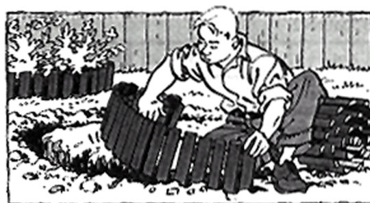
fig. 1 Voorbeeld uit de 'Basistrainer'