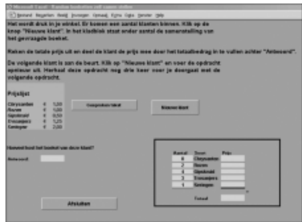
fig. 3 Spreadsheet bij 'Bloemist'

In Bloemist gebeuren alle activiteiten achter het toetsenbord. In de nieuw door de SLO ontwikkelde softwareomgeving Flora beantwoorden de leerlingen een aantal vragen en puzzelen zij aan prijzen van boeketten waarbij in de achtergrond een spreadsheet meedraait. Ook lossen zij een planningsprobleem op bij het bestellen van Kaapse viooltjes. Zij worden daarbij ondersteund door een verborgen, voorgeprogrammeerd spreadsheetwerkblad.