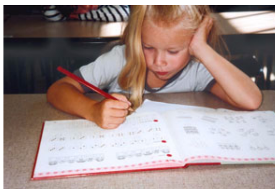
figuur 3: in groep 3 staat het rekenen met de methode centraal

Het zijn vooral deze verschillen die een soepele overgang van groep 2 naar groep 3 belemmeren en die leerkrachten in de onderbouwgroepen de nodige hoofdbreukens bezorgen: Hoe vinden we aansluiting in beide richtingen?