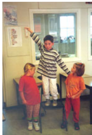
figuur 1: kijk, zo groot was de stier!

De kinderen gaan op hun tenen staan, reiken met hun hand omhoog, maar nee, de stier was nog groter. Een van de kinderen klautert op zijn stoeltje, met zijn hand omhoog: 'Zo hoog was de stier!' 'Dan zou je net de kop van de stier aan kunnen raken.' Alle kinderen moeten dit even uitproberen en hup, de hele klas staat even boven op de stoel.