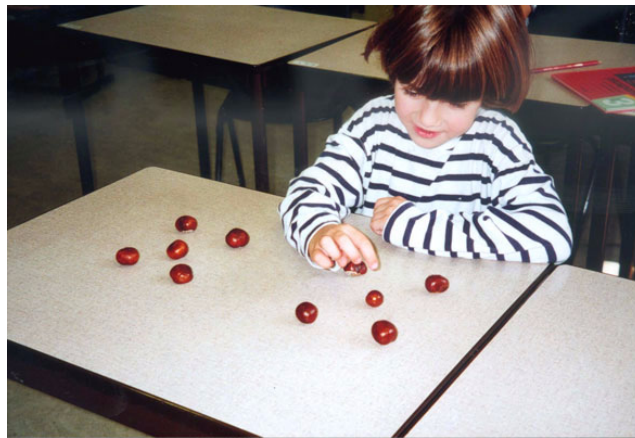
figuur 4: tien kastanjes in dobbelsteenstructuur

De kinderen zijn het er allemaal over eens dat dit het derde voorbeeld is, het voorbeeld met de dobbelsteenstructuur (fig.4).