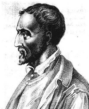
Girolamo Cardano (1501 - 1576)

Het debat over de vraag of (\sqrt{-1})^2 als een getal geaccepteerd kan worden, explodeert als een bijproduct van de oplossingsmethode voor de kubische vergelijking, die Girolamo Cardano in 1545 publiceert in zijn Ars Magna 3 .